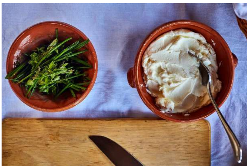
Harmonija zeliščnih namazov