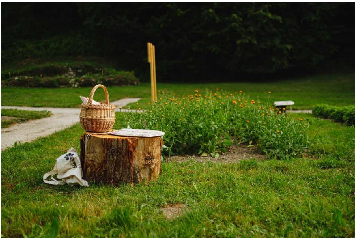
Tišina kartuzijanskega zeliščnega vrta