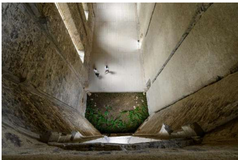
Pogled iz razglednega hodnika nad cerkvenim prezbiterijem

[10:00 – 12:00] Ko bomo izstopili iz energijskega kroga, se bomo počasi poglobili v zgodbo »belih menihov«. Vstopili bomo v obnovljeno Cerkev svetega Janeza Krstnika , prisluhnili zvokom gregorijanskega korala, doživeli počasno pomikanje cerkvene strehe in se nato drug za drugim povzpeli na pohodno ploščad z razgledno nišo nad cerkvenim prezbiterijem. Takšni pogledi se odprejo le malokomu.