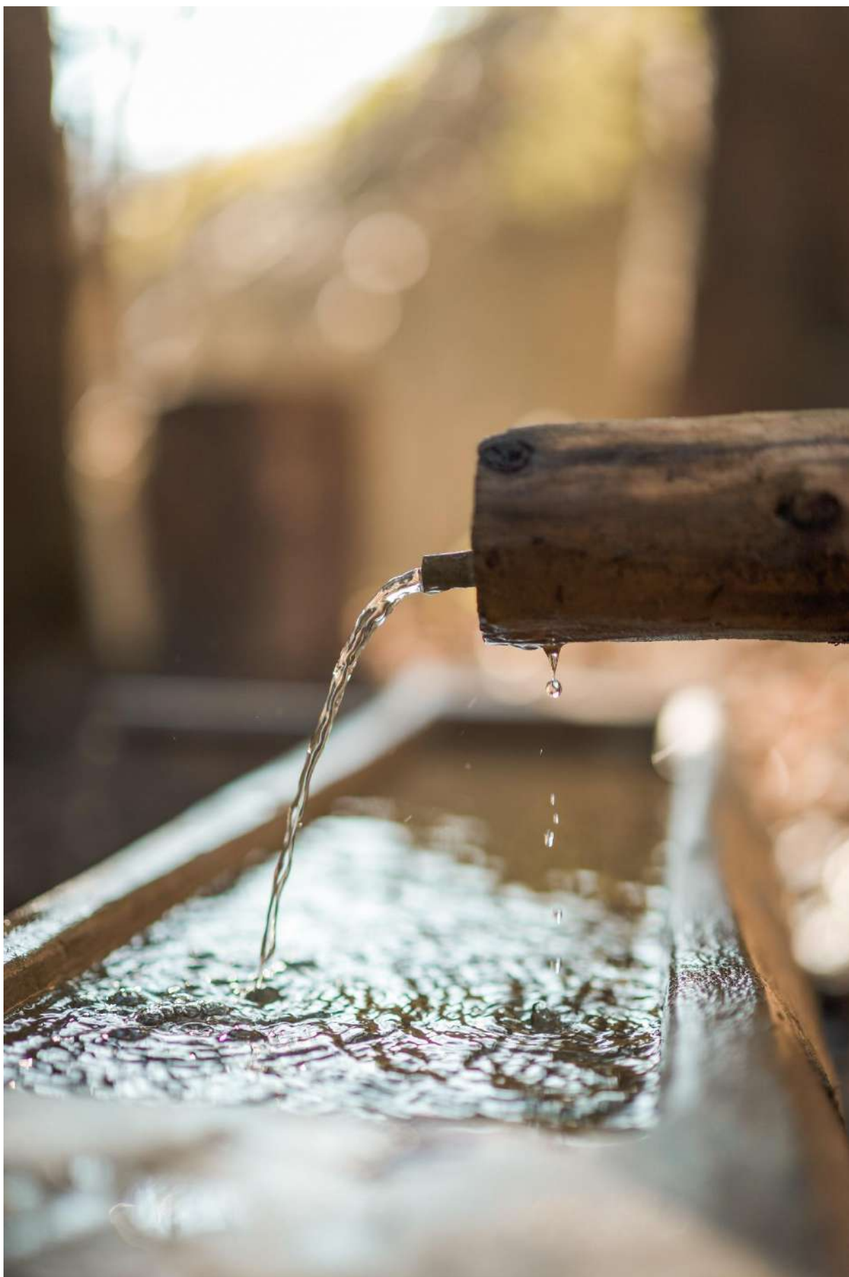
Energijska voda, ki dobro vpliva na vid